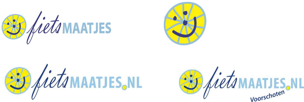
Figuur: oud logo en “lachende wieltje” van Fietsmaatjes (boven) en nieuw logo met logo van lokale Fietsmaatjes (beneden)

Bij erkenning zijn de lokale organisaties gerechtigd om het beeldmerk van Fietsmaatjes te dragen (oud of nieuw logo, zie boven). Om dit mogelijk te maken voert de stichting het eigendom van het beeldmerk van Fietsmaatjes. Dit beeldmerk is geregistreerd 2 . De merk inschrijving in de Benelux is: